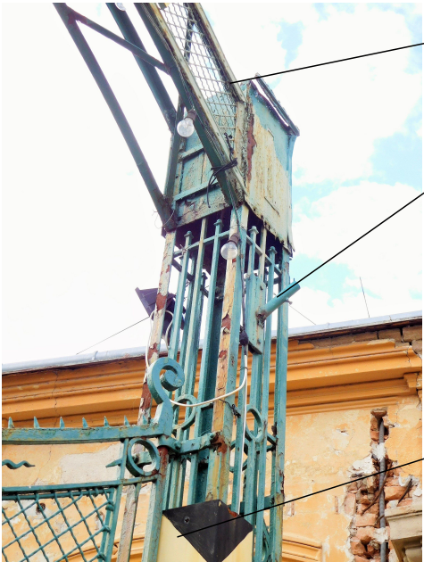
VRCHOL PRAVÉHO SLOUPU

DETAIL - UKÁZKA STAVU KOVOVÝCH KONSTRUKCÍ - OXIDACE POD BARVOU